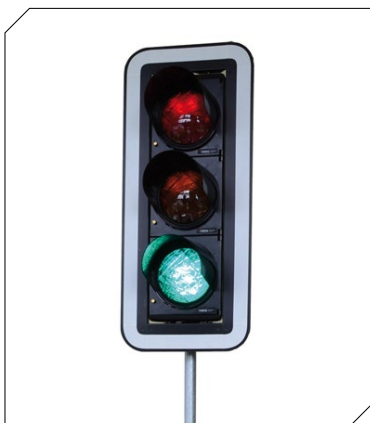
QA-Basic mit Kontrastblende (Aufpreis)