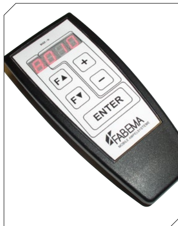
Kabellose, berührungsfreie Programmierung